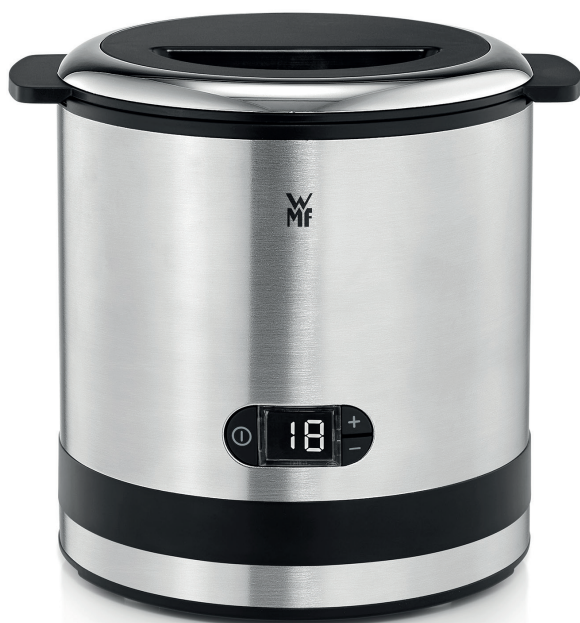
WMF KÜCHENminis® Zmrzlinovač 3 v 1